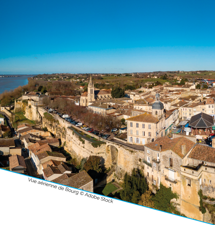
Vue aérienne de Bourg